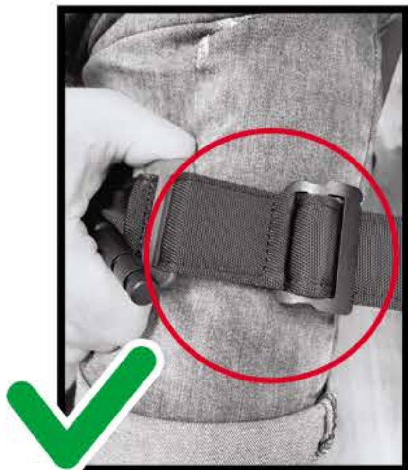
СХЕМА НАКЛАДАННЯ ДЖГУТА НА НИЖНЮ КІНЦІВКУ:

Правильно використовувати джгут, провівши стрічку через два отвори пряжки та притримуючи однією рукою за стоп-фіксатор щільно затягнути джгут другою рукою.